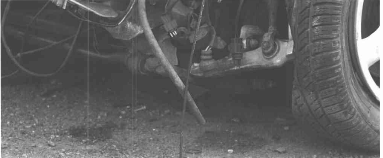
foto 3 Blijkbaar zijn de vloeistoffen nog niet allemaal afgetapt.