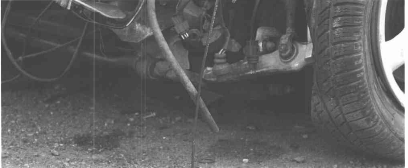
foto 3 Blijkbaar zijn de vloeistoffen nog niet allemaal afgetapt.